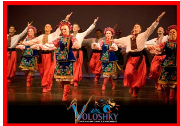
Танцювальний Ансамбль ВОЛОШКИ ( Philadelphia )