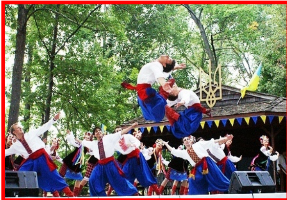
Танцювальний Ансамбль СИЗОКРИЛІ ( New York City )