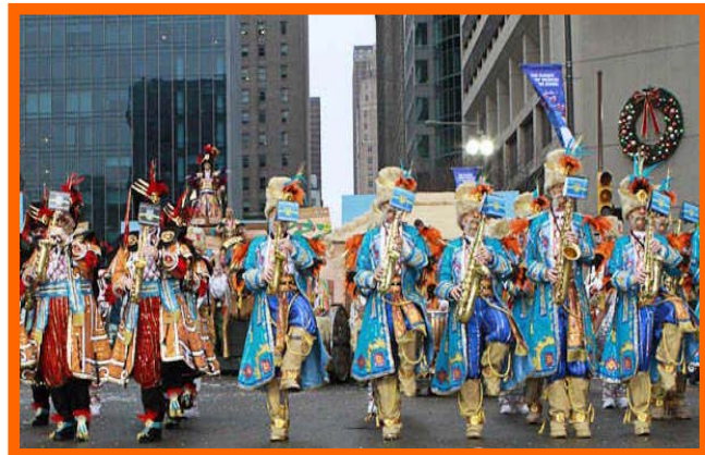
Струнна Оркестра Фрелінджер ( Philadelphia )